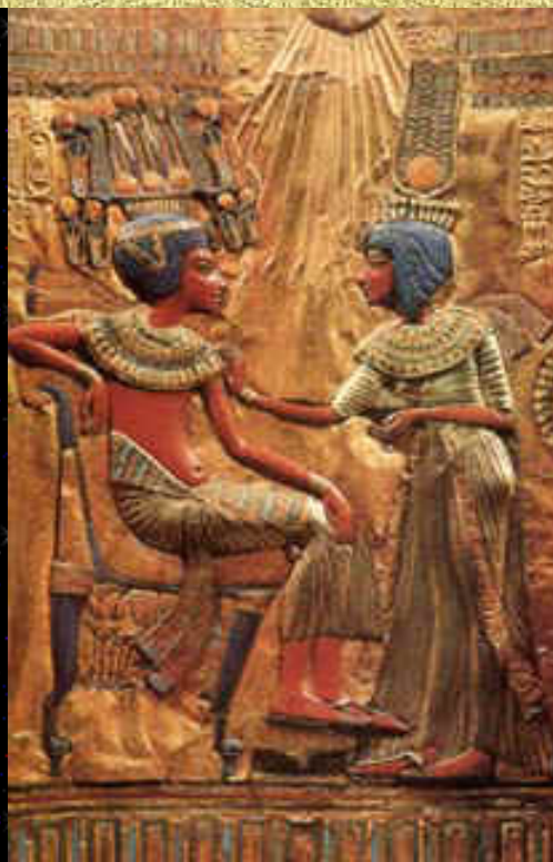
Tutankhamon e Ankhnesenamun

Você pode entender Ordem Rosacruz como um sistema de estudo, iniciação e trabalho para o despertar do Cristo Cósmico como Cristo Interior de cada um. Esse tipo de Cristo é o Cresto Solar emanado pelo Grande Sol Central, não estando, obviamente, vinculado a apenas um planeta e muito menos a uma religião. Akhenaton recebeu esse conhecimento revelado e modificou a religião do Antigo Egito, que era politeísta, tornando-a monoteísta, voltada para Aton (o Sol), único Deus, Originador e Mantenedor da Vida na Terra, como representação física, na matéria densa, do Grande Sol Central, suprafísico e Eterno. Tuth-Ankh-Amon, filho