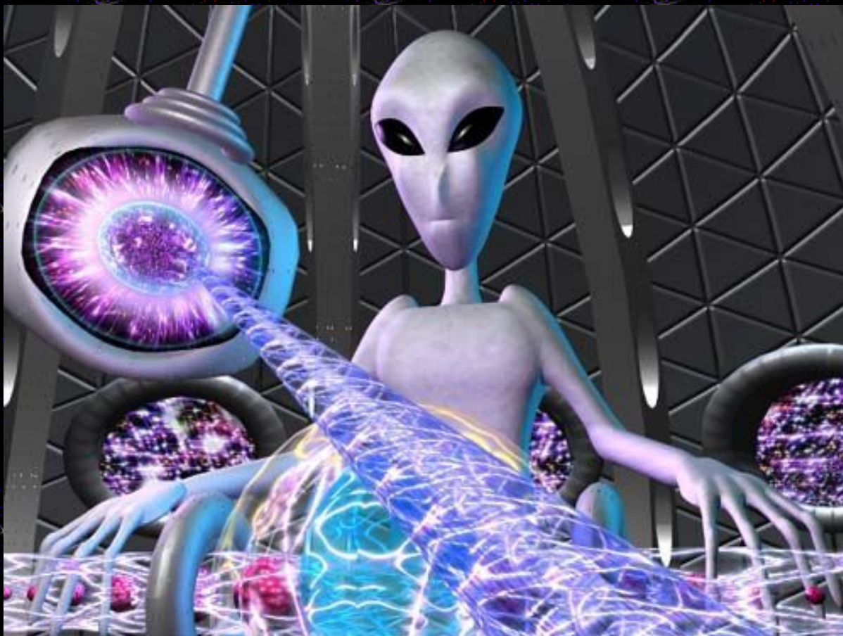
Concepção artística de um ET clássico