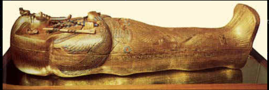
Sarcófago de Tutankhamon

Em um templo do Novo Reino, a centenas de milhas do Cairo, há alto relevos nas paredes de pedra mostrando vários tipos de naves espaciais. Em uma tumba faraônica vê-se um alto relevo que mostra a figura de um extraterrestre. As evidências do contato dos humanos com os habitantes de outros mundos não se limitam ao egito: na Índia livros sagrados fazem referência aos Vimanas, que eram "carros dos deuses" e cuja descrição faz pensar em aeronaves.