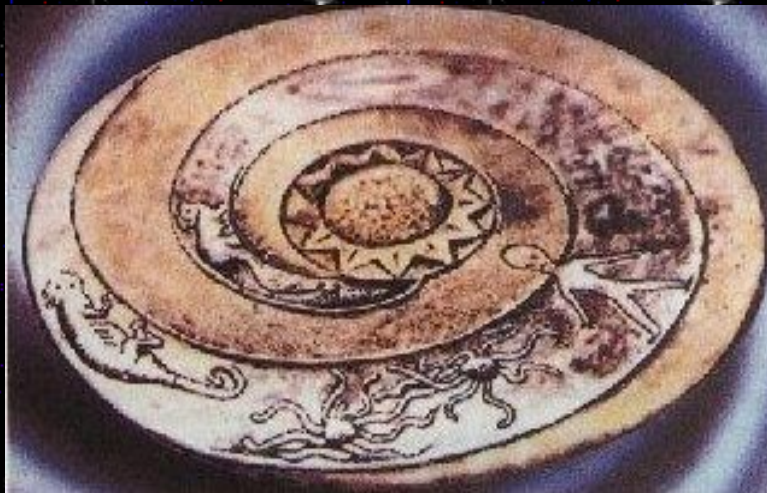
À esquerda, acima, alto relevo mostra várias espaçonaves, em parede de templo do Novo Reino do Antigo Egito (Khem). Em baixo, peça artística do Nepal mostra disco voador (ao centro).

Há Ordens e Fraternidades Rosacruzes que incluem em seus estudos ensinamentos sobre esse tema e exortam os estudantes a fazerem experimentos para tentar o contato com seres extraterrestres. Esse contato se daria pela Consciência Cósmica, ou seja, seria instantâneo, deixando a velocidade da Luz muito para trás. Esta é uma hipótese que os estudantes de Rosacrucianismo da atualidade pelo menos não podem deixar de examinar.