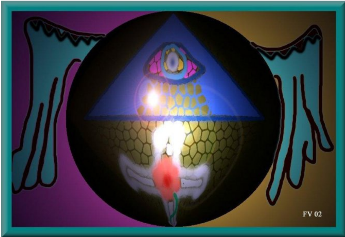
CLIQUE NO QUADRO PARA VÊ-LO EM TAMANHO NATURAL NA GALERIA Ilustração: "A Sagrada Construção do Mestre Interior" Quadro do Frater Velado exposto na Frater Velado's Art Gallery

sua empresa se tornará realidade. Toda vez, porém, que esse tipo de criação mental se materializa, a sua contraparte antimaterial é criada e a entropia se manifesta. Por isso, que não se espere a eternização das criações mentais concretizadas na Matéria. Você não precisa ser um místico para fazer isto e vou citar um exemplo: Bill Gates.