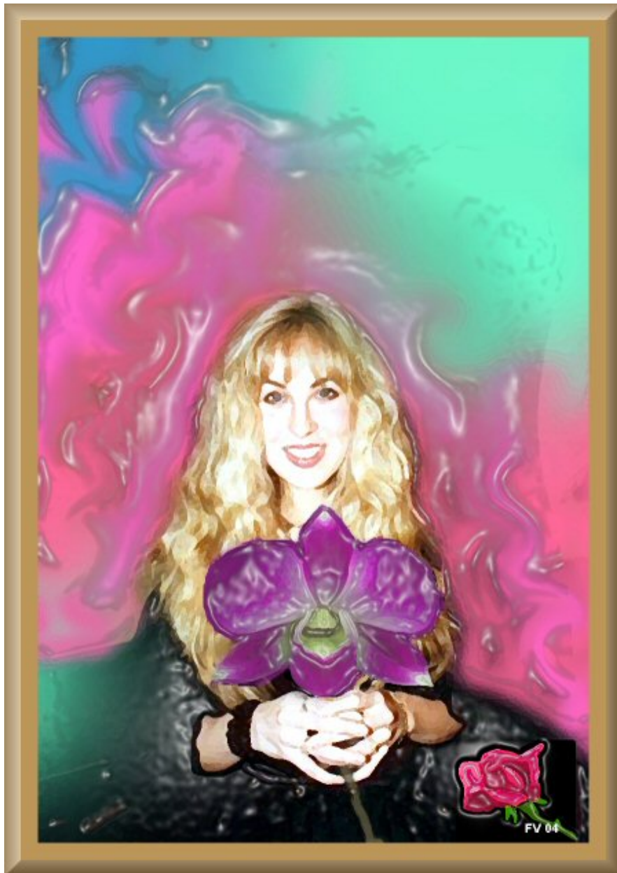
CLIQUE NO QUADRO PARA VÊ-LO EM TAMANHO NATURAL NA GALERIA Ilustração: "Retrato de Candice Night" Quadro do Frater Velado exposto na Frater Velado's Art Gallery

completa: instrumentos de percussão, como tambores meramente musicais ou atabaques ritualísticos afetam o sistema nervoso simpático de todos e um mantra exerce efeitos característicos que atravessam fronteiras planetárias e interestelares. Os místicos conhecem as propriedades mágicas do diapasão físico e de seu originador imaterial e sabem que a música é um termômetro da Evolução.