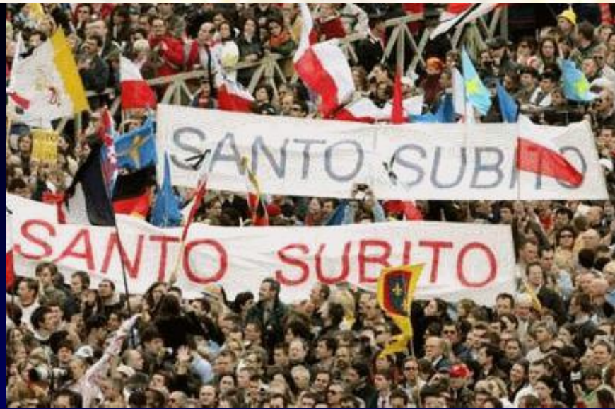
No funeral de João Paulo II a multidão exige sua canonização imediata