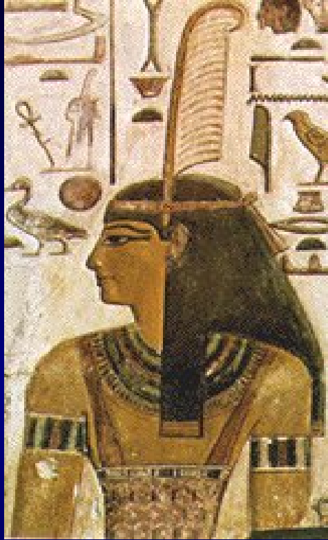
Maat, Deusa da Ética