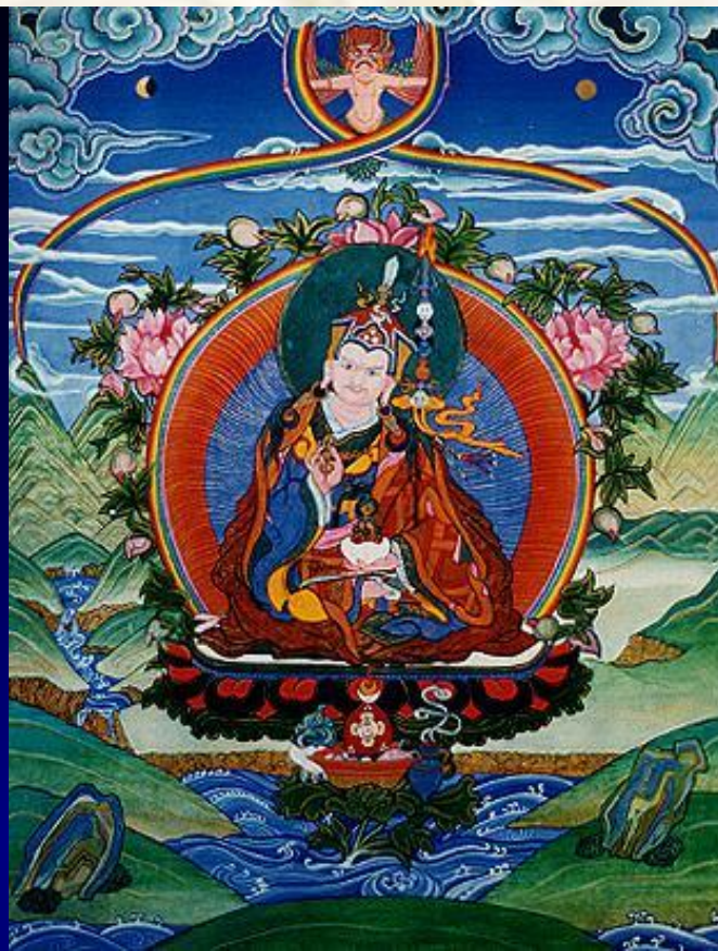
Guru Rinpoche (Peça de Arte Tibetana)