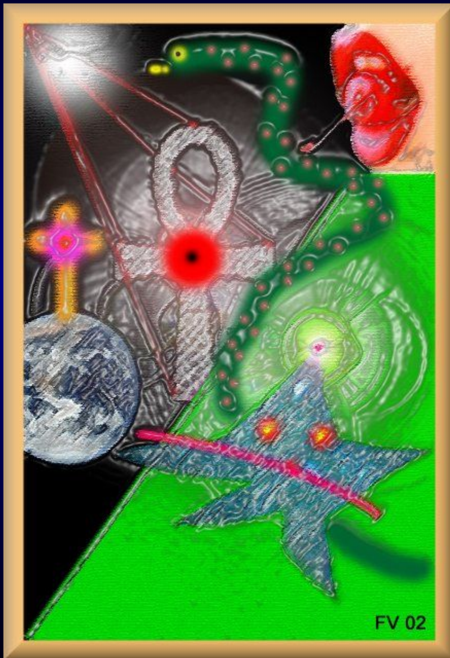
"Esoteric Mailing List" (Frater Velado, 2002CE) Clique na imagem acima para ver este quadro em tamanho original na Galeria de Arte do Frater Velado