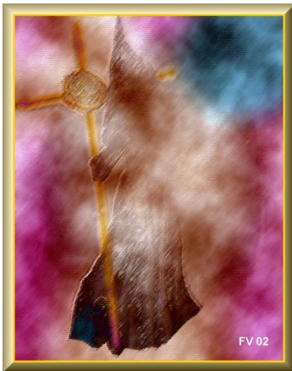
Ilustração: "O Irmão Leigo da Ordem Rosacruz" Quadro do Frater Velado exposto na Frater Velado's Art Gallery http://macarlo.com/novaera/galleryvel459.htm

A missão do Irmão Leigo não é das mais fáceis, porque suas revelações mexem com os acomodados e, assim, muitas imprecações e insultos lhe são dirigidos. Além de não poder responder aos agressores, deve rezar por eles, para que sejam iluminados - e com isso alguma Luz vai se fazendo sobre os Irmãos da Face Sombria, que tentam, inutilmente, sabotar seu trabalho. Através da atuação dos Irmãos Leigos os Irmãos Maiores, da Ordem Rosacruz Verdadeira, Eterna e Invisível, já conseguiram redimir alguns Irmãos da Face Sombria. Os Irmãos Maiores não atuam diretamente nos