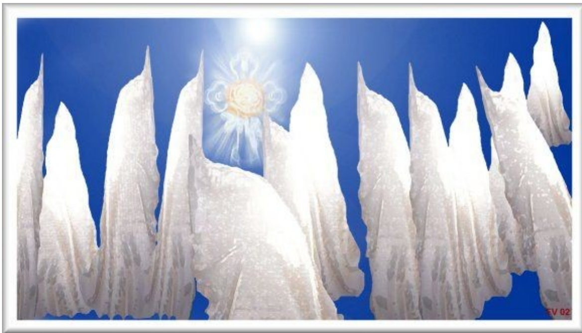
Ilustração: "Os 13 Irmãos Maiores e a R+C Verdadeira" Quadro do Frater Velado exposto na Frater Velado's Art Gallery http://macarlo.com/novaera/galleryvel455.htm

N AS CERIMÔNIAS Secretas das Ordens Internas os Adeptos têm oportunidade de interagir diretamente com os Mestres Invisíveis da Ordem Rosacruz Verdadeira, Eterna e Invisível. Essa interação é feita principalmente para a cura de doenças e amenização do sofrimento de seres. Os Mestres Invisíveis não possuem corpo físico, nem nomes, nem rostos, mas cada um deles mantém a sua individualidade, de forma que podem ser reconhecidos e diferenciados uns dos outros. Apenas esses Mestres Cósmicos é que podem ser chamados de Rosacruz, sendo todos os demais estudantes de Rosacrucianismo , inclusive os Adeptos e todos os dirigentes de Ordens e Fraternidades R+C manifestadas nos Planos Físicos. Assim, pode-se dizer que não existe um único Rosacruz encarnado na Terra e o máximo a que um Adepto pode chegar em tal Plano é à condição de Irmão Leigo da Ordem Rosacruz Verdadeira, Eterna e Invisível – o que significa apenas e tão-somente servir.