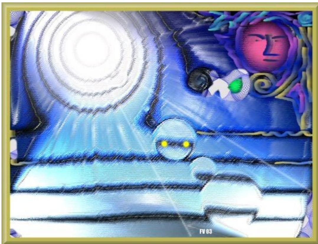
“Genesis” (Frater Velado 2003CE) Quadro sobre a criação dos Universos http://digital-matrix.org/enggenesis.htm