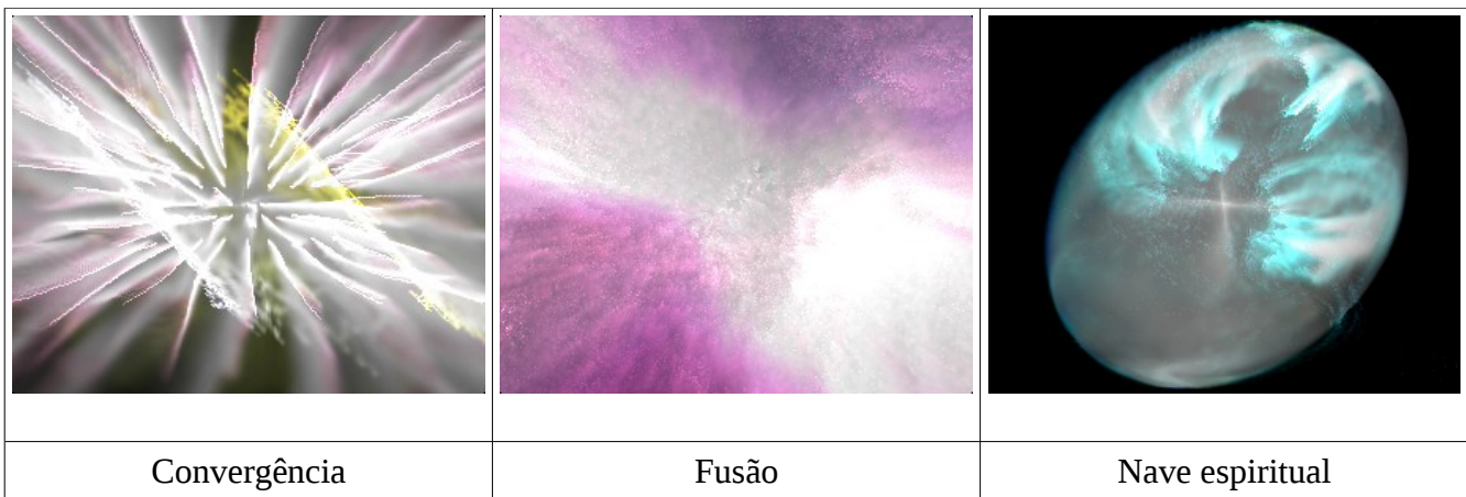
Fotos do Laboratório de Illuminates Of Kemet (Imagens transladadas para entendimento humano)