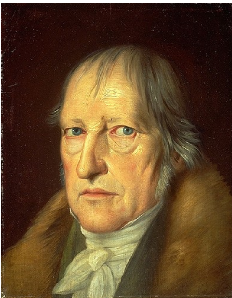
Georg Wilhelm Friedrich Hegel