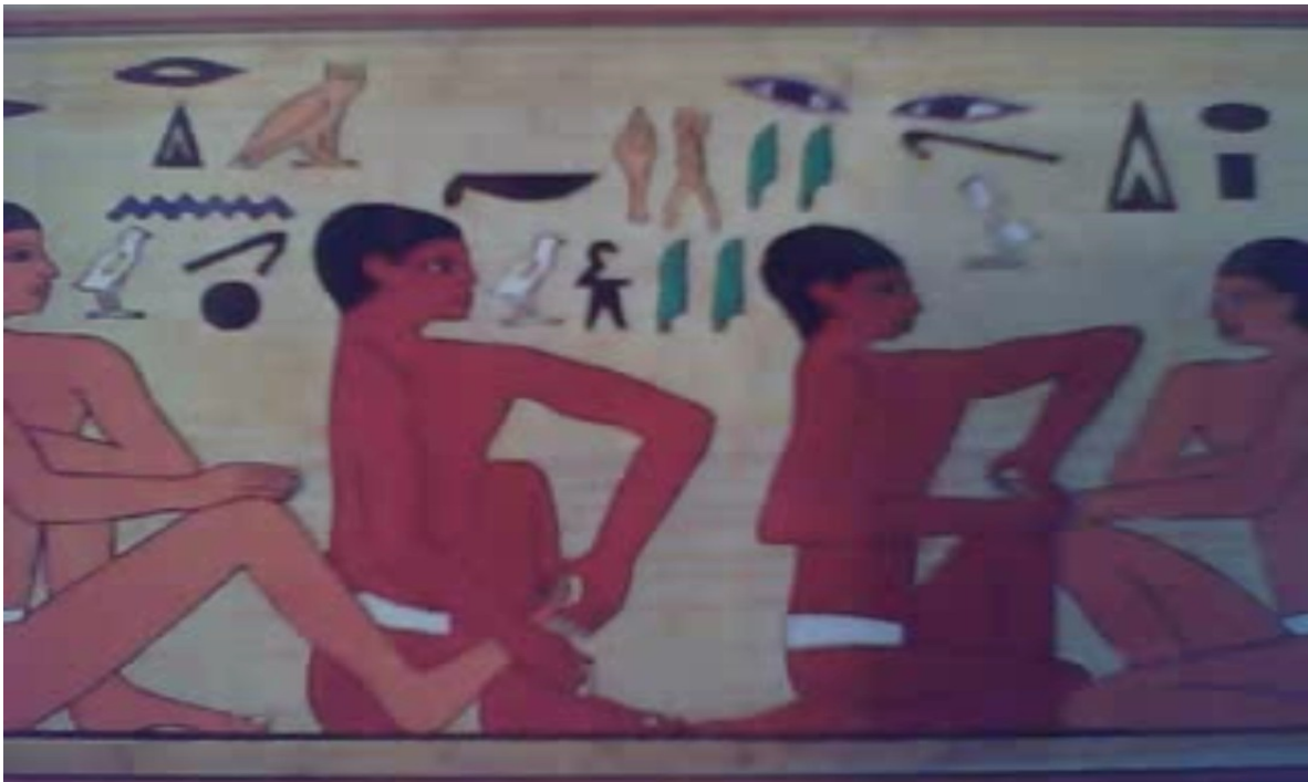
Prática conjunta de Yoga em Kemet

O Yoga Kemetico se baseia principalmente no suposto percurso da Barca de Ra pela abóbada celeste, na verdade a rotação terrestre que produz dia e noite neste planeta, com a aparente movimentação do Sol (Ra) do horizonte ao pino (Zenith). O yogi KMT executa com o corpo uma série de posições que se parecem com os estágios do suposto percurso solar e que, também, se referem às concepções de Nut elevada por Shu sobre Gheb.