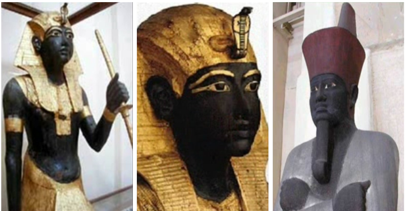
Os faraós, de raça negra

complementação da obra do Iniciador, o asteroide KLK (Kalki). Esse monumental trabalho é, na verdade, uma sessão planetária de Sema Tawy, que harmonizará momentaneamente dois hemisférios cósmicos: o do planeta físico Terra, com sua aura, e o de um novo planeta quadridimensional, Terra 2, para o qual os seres reparados serão ascensionados (esse evento é descrito em Monografias Públicas da IOK-BR, que estão online para leitura e download em seu website oficial). Por aí dá para se perceber a importância da prática do Yoga Kemetico por parte daqueles que estão empenhados na Grande Obra.