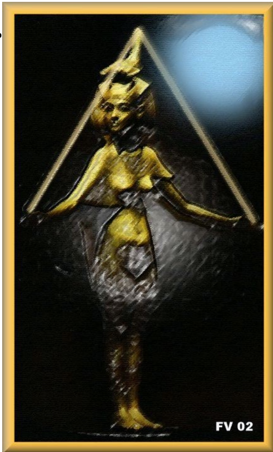
A Deusa Selket em uma posição do Yoga Kemético Quadro do Frater Velado (2002CE)

http://macarlo.com/novaera/galleryvel515.htm