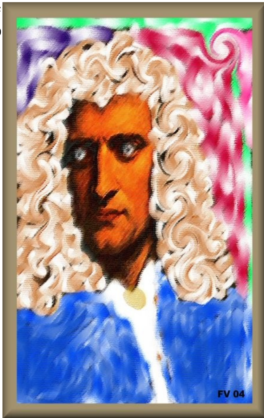
Retrato de Isaac Newton (Frater Velado, 2004CE)

http://macarlo.com/novaera/galleryvel617.htm