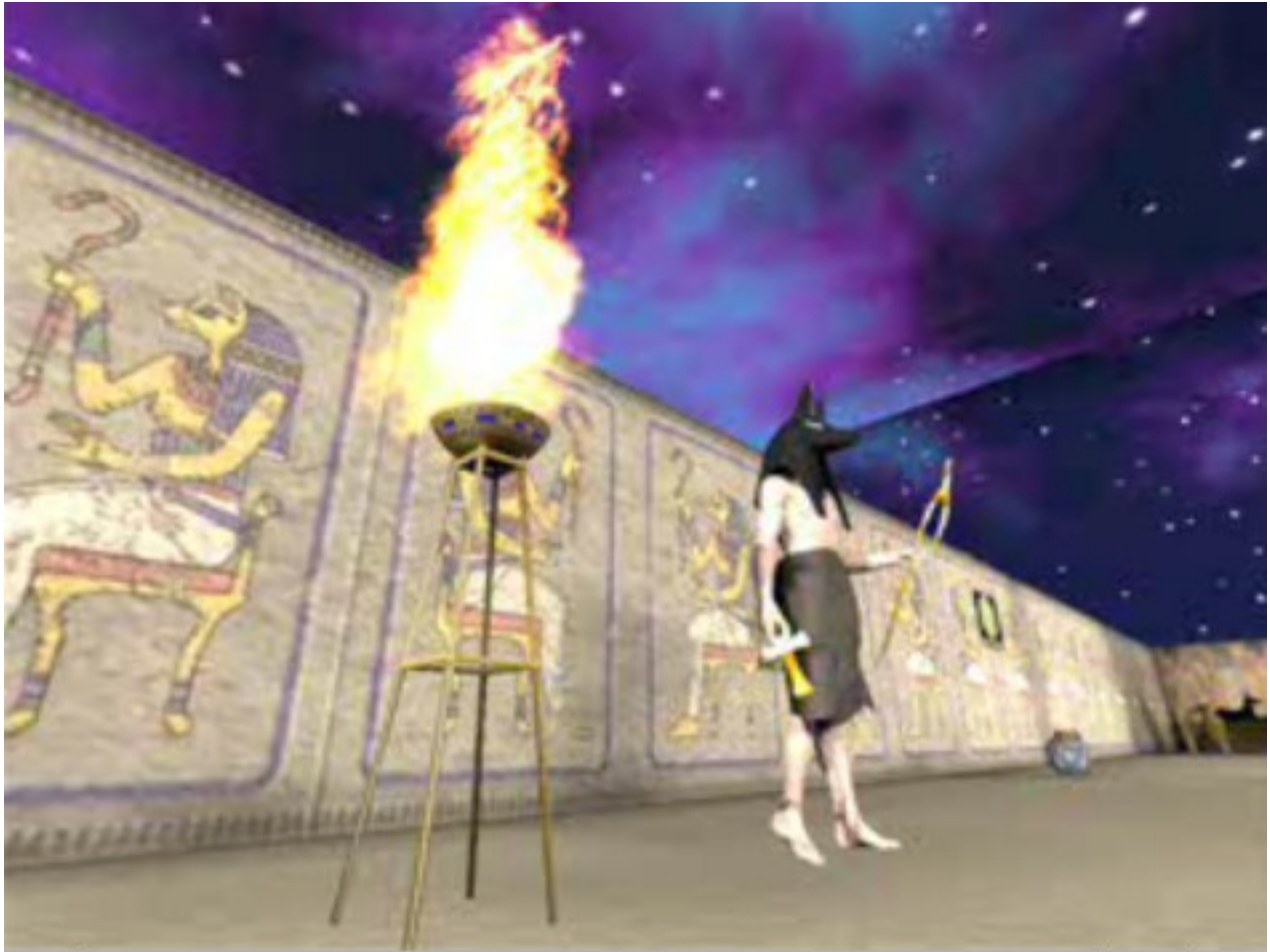
Yinepu, o Guardião