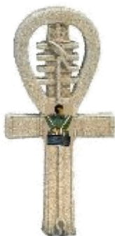
Ankh de IOK