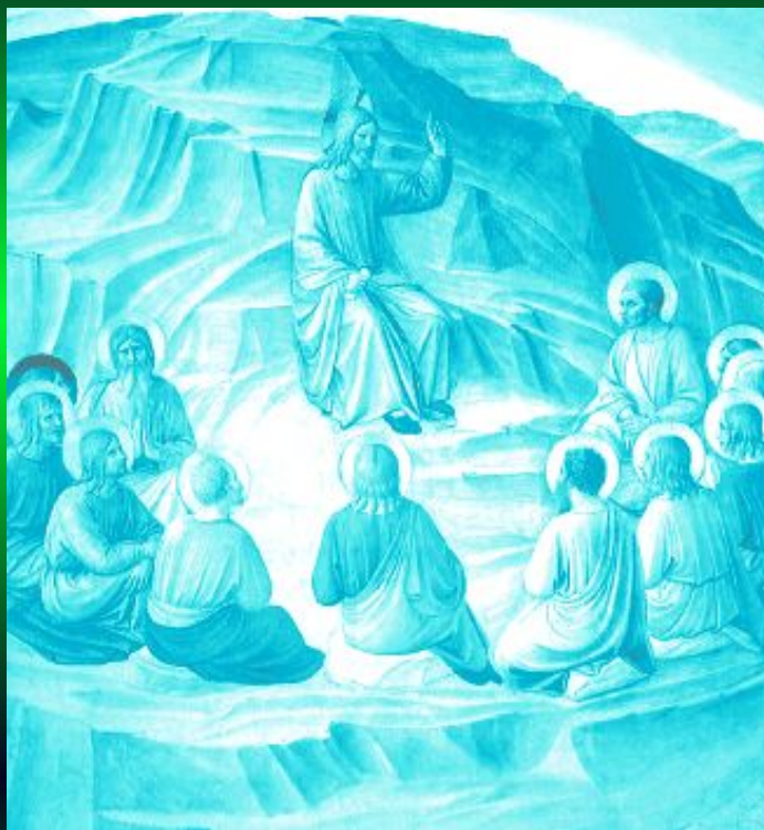
"O Sermão da Montanha" Afresco, Fra Angelico (1387-1455), Museu de São Marcos, Florença, Itália

Enquanto os dez mandamentos originados de Jeovah são dirigidos particularmente para subjugar o corpo do desejo, os princípios enunciados por Jesus Cristo no Sermão da Montanha trabalham no corpo vital e emanam diretamente do Mundo Superior do Santo Espírito. Estudantes Rosacruzes devem se esforçar em ver somente os bons aspectos em suas interações diárias uns com os outros e com todos de uma forma geral - este é um extrato dos princípios do Sermão da Montanha para aplicação prática no dia-a-dia. Quando identificada