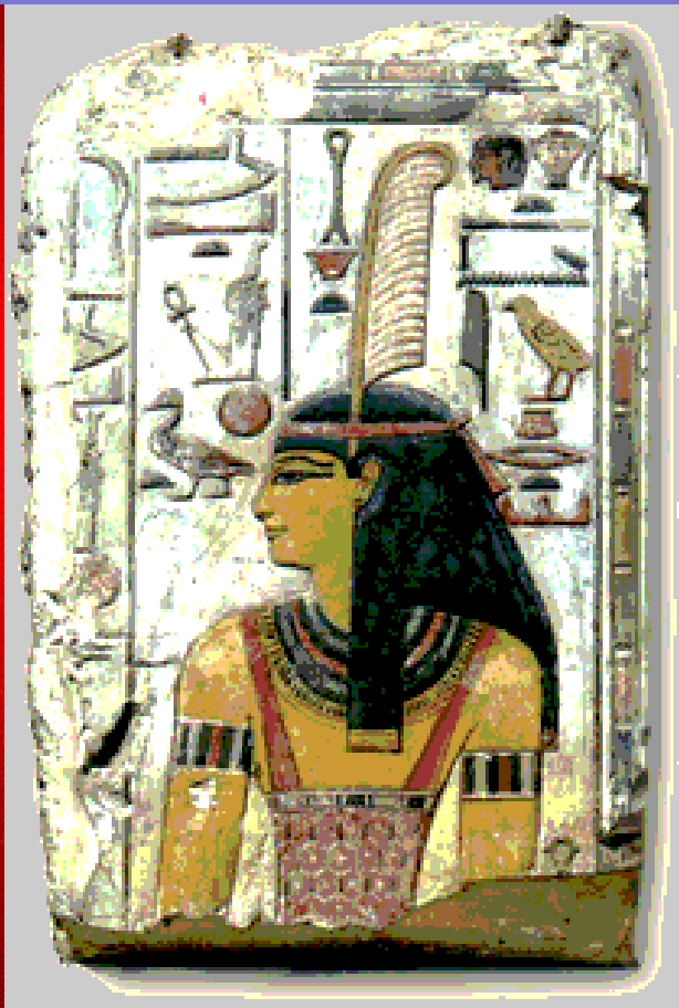
Maat, Deusa da Verdade do Panteão de Khem